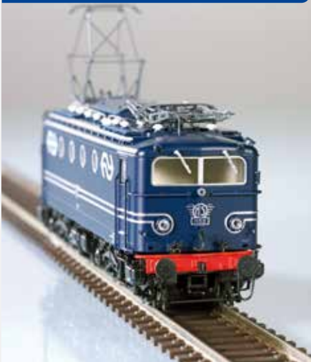
Realistische Form- u. Farbgebung